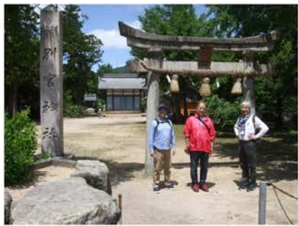
松原駅の比定地と推定される櫛川にある別宮神社