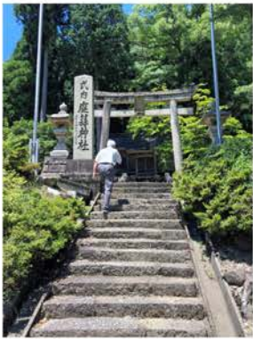
当時の敦賀郡鹿藪駅の比定地といわれる鹿藪神社（現南越前町）

と。 駅家には駅馬といわれる馬を 飼育し、駅ごとに馬を乗り換え て次の駅に向かう。馬は大路の 駅には20疋、中路の駅には10疋、 小路の駅には5疋配置されるの が原則であったが、駅そのもの が持つ地理的条件などによって も増減があった。