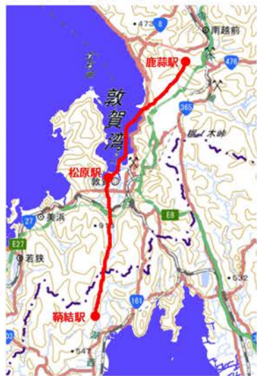
敦賀近辺の3駅の位置図

駅家とは、古代 日本の五畿七道の 駅路沿いに整備さ れた施設。単に駅 （えき）とも称す る。原則として30 里（現在の約16キ