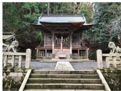
鞆結駅の比定地といわれる鞆結神社（現滋賀県高島市マキノ町）

た。駅使とは当時、駅馬に乗用 することが許された公的な使者。 律令諸国に張り巡らせられた駅 路を通じて、情報の伝達を行う ことを主な使命とした役人のこ